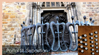
Portal St. Sebastian