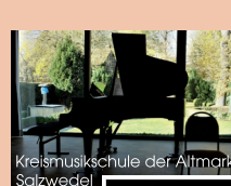
Kreis Musikschule der Altmark Salzwedel