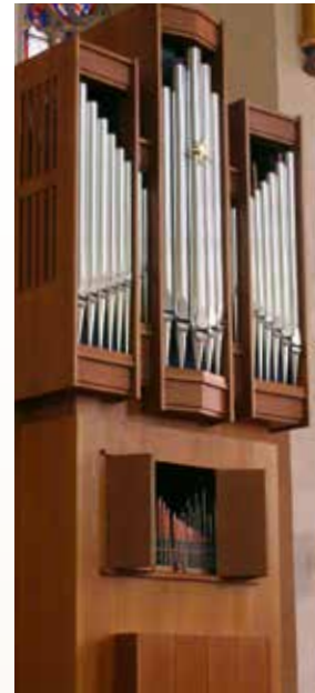
Im Orgelprospekt ist ein Zimelstern-Register enthalten.

Im Jahre 2017 wurde das Instrument gereinigt und neu intoniert. Sie erhielt eine neue Temperierung nach Neidhardt (kleine Stadt). Die Arbeiten wurden von der Firma Vogtländischer Orgelbau Thomas Wolf, Limbach, ausgeführt.