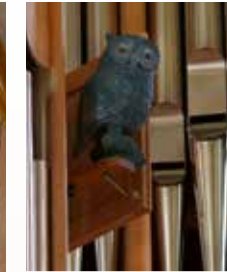
Im Orgelprospekt befindet sich ein Eulen-Register.